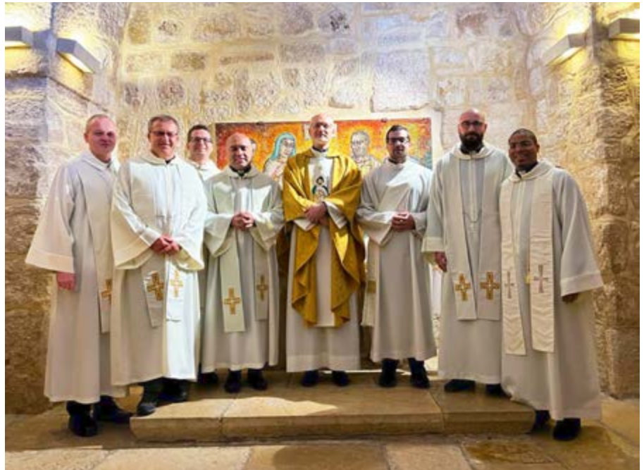
DUSZPASTERZE WSPÓLNOTY HEBRAJSKOJĘZYCZNEJ (WŚRÓD NICH CZTERECH POLAKÓW)

Sz szczególnie barwna jest Cerkiew Rosyjska, która posiada kościoły i klasztory wokół Jerozolimy i na terenie całego Izraela, a święta, procesje i pięknie wyśpiewywane hymny religijne znacząco wzbogacają liturgiczną mozaikę Ziemi Świętej. Podobnie ortodoksyjne Kościoły orientalne (obrzędkiem przedchalcedońskiego), Apostolski Kościół Ormiański (naród ormiański był pierwszym, który przyjął chrześcijaństwo jako religię narodową) oraz trzy Kościoły wschodnie reprezentujące starożytne tradycje chrześcijaństwa: Koptyjski Kościół Ortodoksyjny, Syryjski Kościół Ortodoksyjny i Etiopski Kościół Ortodoksyjny. Z kolei obecne w Ziemi Świętej od XIX wieku Kościoły protestanckie wybudowały tam okazałe budynki, świątynie i mocno zaznaczają swoją obecność, prowadzą bowiem intensywną działalność misyjną i uczestniczą