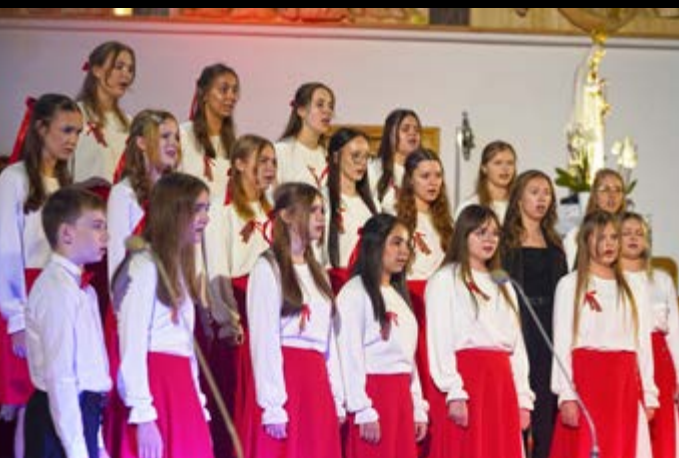
9 XI KONCERT W 107. ROCZNICĘ ODZYSKANIA NIEPODLEGŁOŚCI. CHÓR LA MUSICA