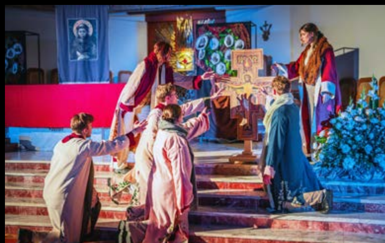
5 X ORATORIUM O ŚWIĘTYM FRANCISZKU