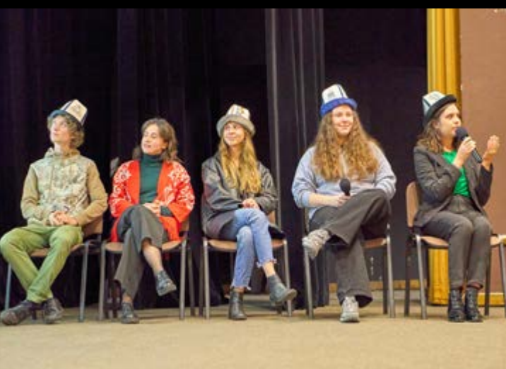
19 X MISJA KIRGISTAN – SPOTKANIE Z UCZESTNIKAMI WYJAZDU