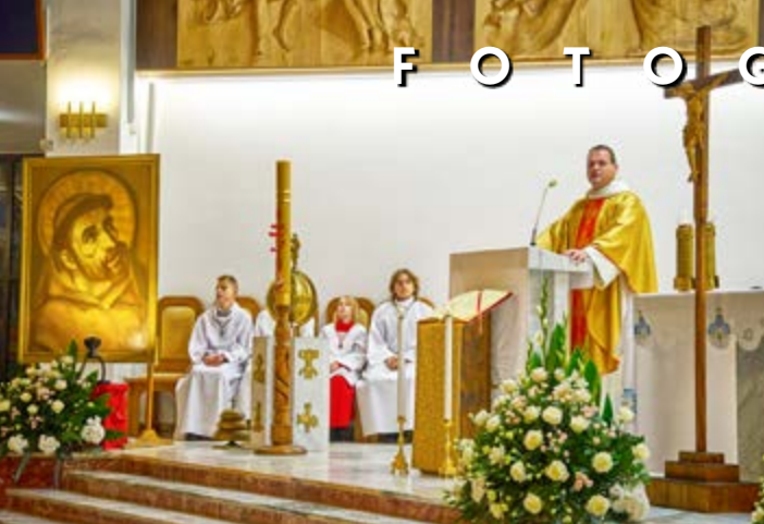
4 X ODPUST ŚWIĘTEGO FRANCISZKA