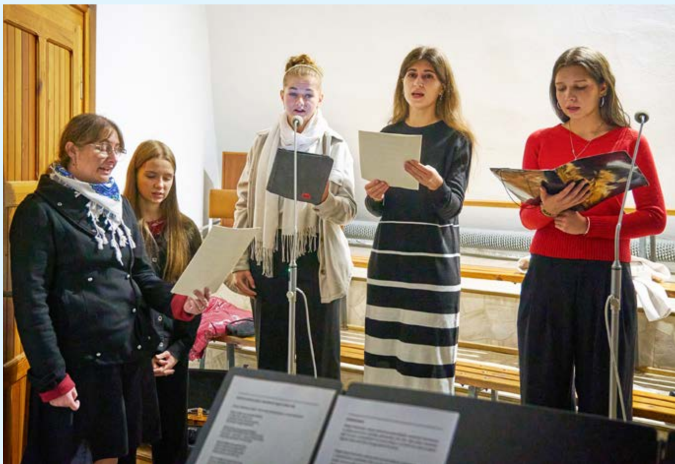
TRANSITUS WYKONYWANY PRZEZ SCHOLĘ LUX MUNDI W UROCZYSTOŚĆ ŚW. FRANCISZKA 2025.

Korzystam z wielu źródeł. Jednak najczęściej sięgam do śpiewników śląskich czy starszych wydań śpiewnika księdza Jana Siedleckiego, w których zachowane są stare, niekiedy nieużywane już pieśni.