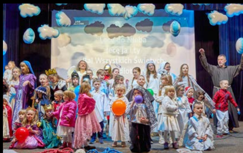
8 XI BAL WSZYSTKICH ŚWIĘTYCH