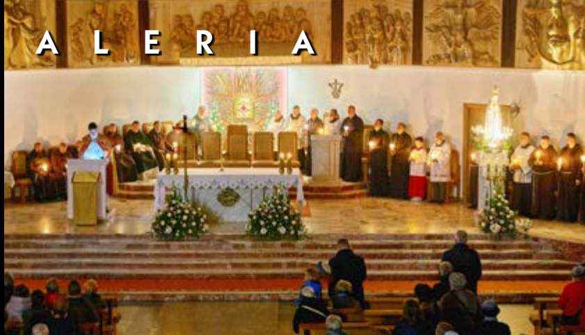
4 X TRANSITUS