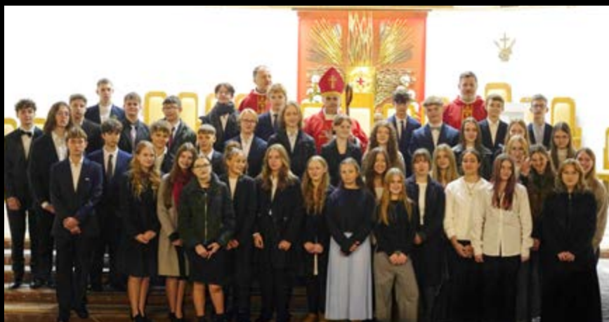
14 XI SAKRAMENT BIERZMOWANIA