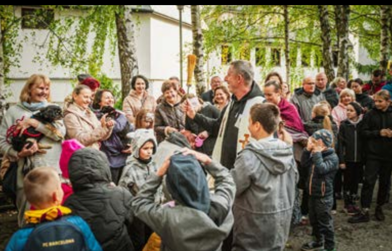
5 X NIEDZIELA ŚWIĘTEGO FRANCISZKA