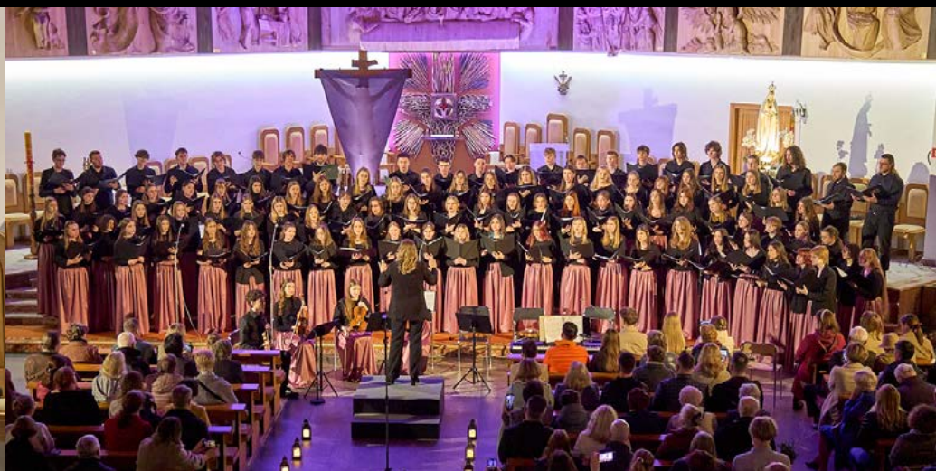
13 IV WIELKOPOSTNY KONCERT CHÓRÓW COPERNICUS I AXIS MUNDI