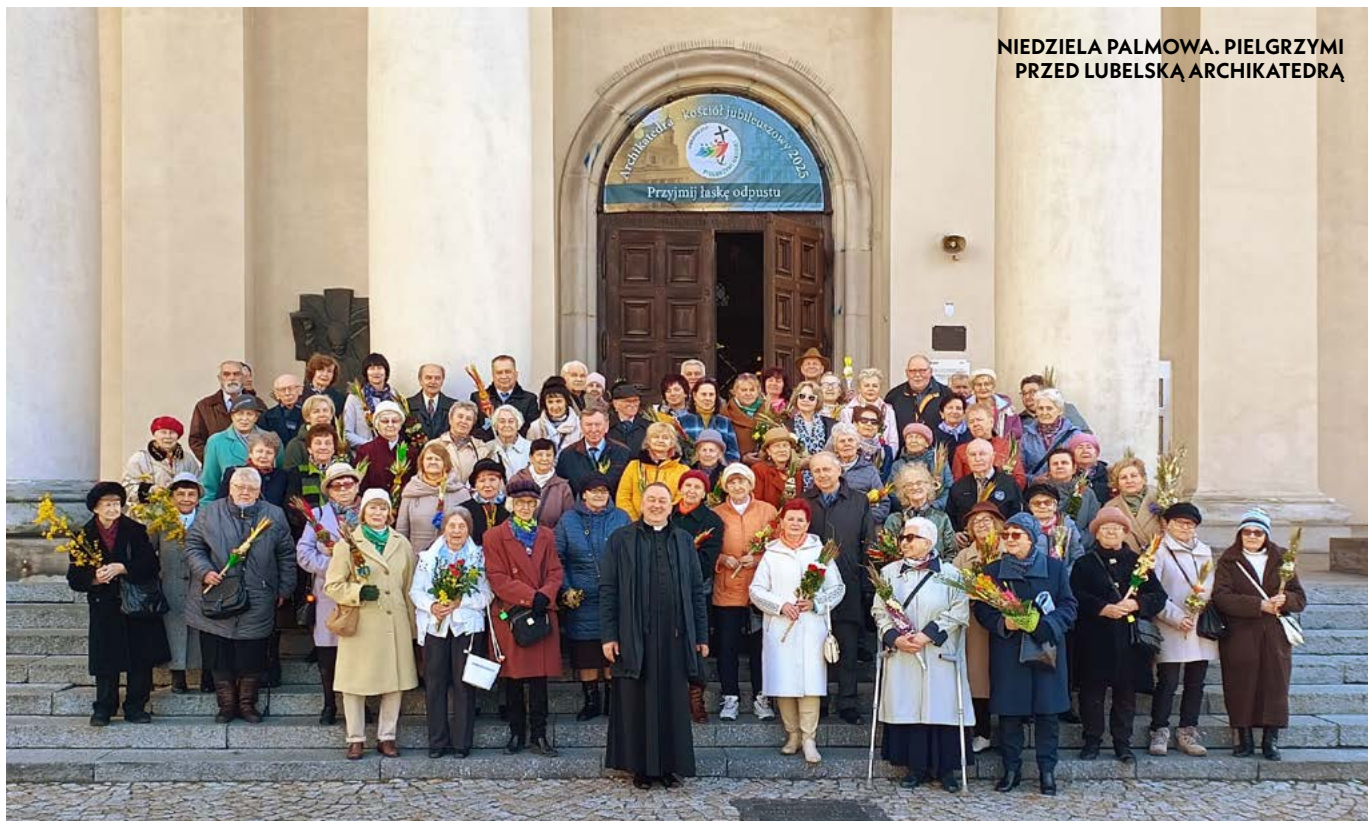
NIEDZIELA PALMOWA. PIELGRZYMI PRZED LUBELSKĄ ARCHIKATEDRĄ