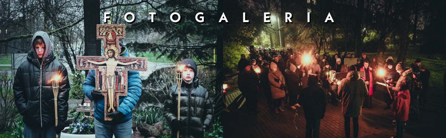
11 IV DROGA KRZYŻOWA ULICAMI PARAFII