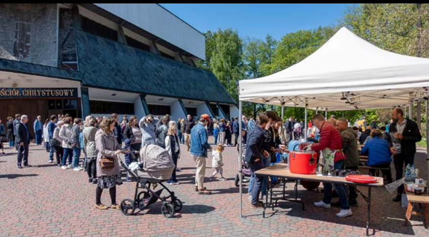
27 IV GROCHÓWKA STOWARZYSZENIA PRZYJACIÓŁ PARAFII POCZEKAJKA