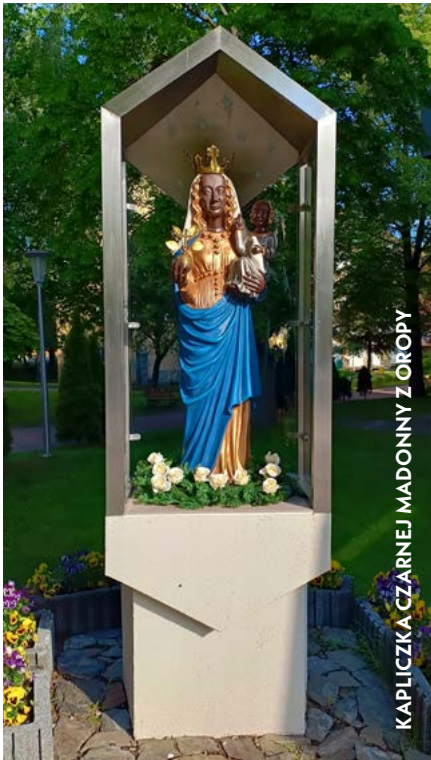
KAPLICZKA CZARNEJ MADONNY Z OROPY