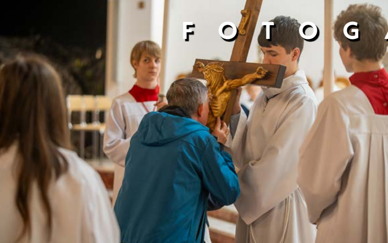
18 IV WIELKI PIĄTEK