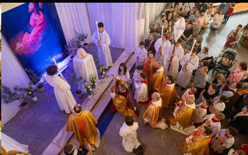
17 IV WIELKI CZWARTEK