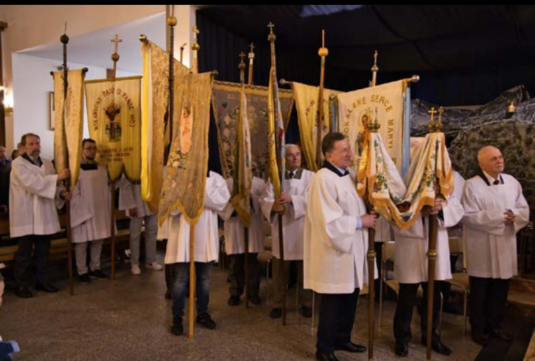
20 IV NIEDZIELA ZMARTWYCHWSTANIA PAŃSKIEGO. PROCESJA REZUREKCYJNA