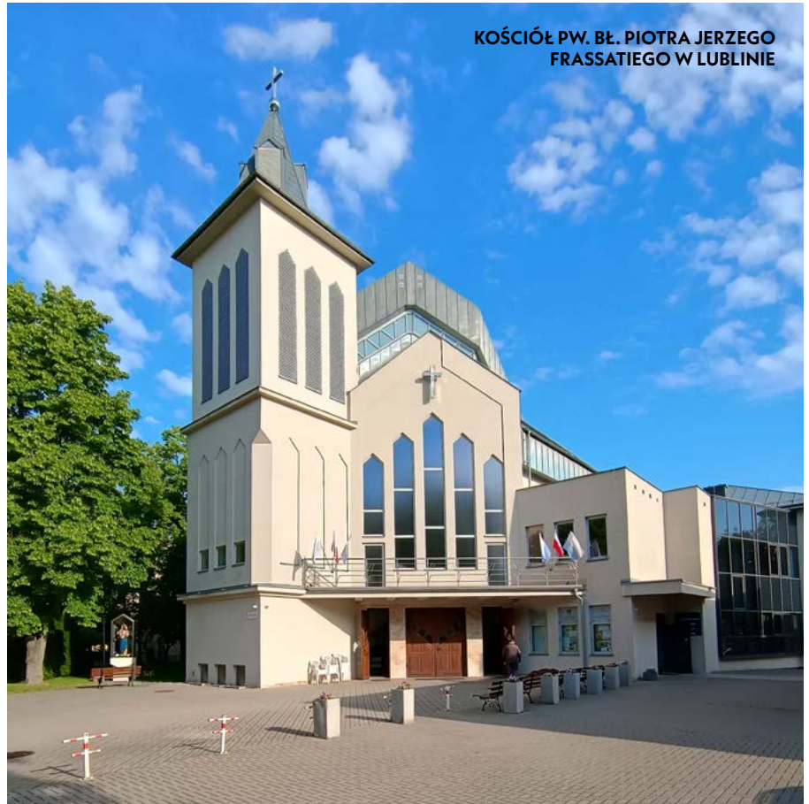
KOŚCIÓŁ PW. BŁ. PIOTRA JERZEGO FRASSATIEGO W LUBLINIE

Czarna Madonna z Oropy to słynąca łaskami figura wyrzeźbiona z drewna cedrowego. Jej kopia znajduje się w kapliczce obok kościoła pw. bł. Piotra Jerzego Frassatiego przy ul. Skierki 12 w Lublinie.