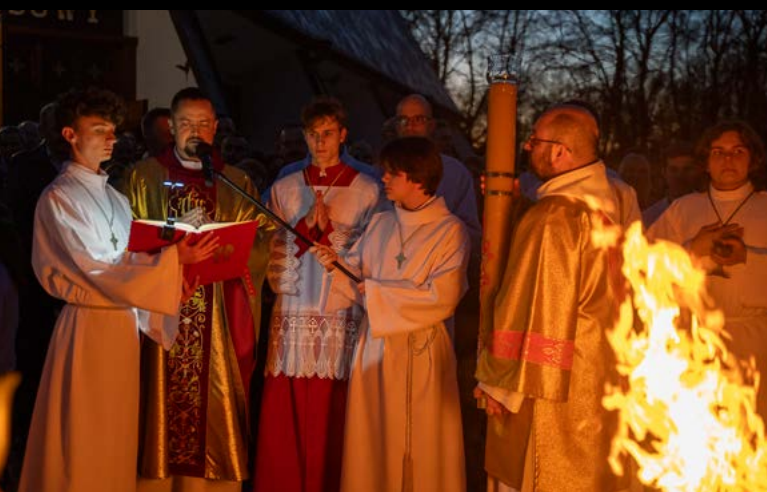
19 IV WIELKA SOBOTA