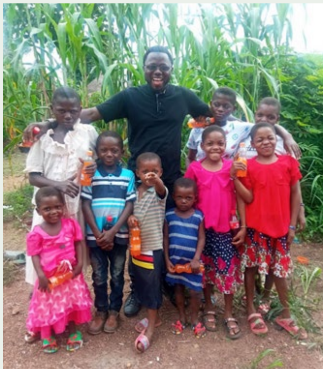
BRAT MARTINS Z SIOSTRZENICAMI I BRATANKAMI

Moje zgromadzenie zakonne nazywa się: Zgromadzenie Synów Niepokalanego Poczęcia (CFIC). Jest to zgromadzenie zakonne na prawie papieskim, którego charyzmatem jest świadczenie o Chrystusie poprzez opiekę nad chorymi, edukację potrzebują-