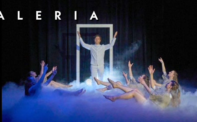
23 III SPEKTAKL TANECZNY „LILIA”. TEATR TAŃCA LILIA Z KRAKOWA