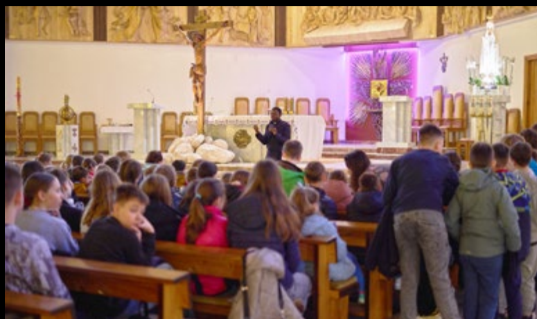
III REKOLEKCJE DLA UCZNIÓW SZKÓŁ PODSTAWOWYCH