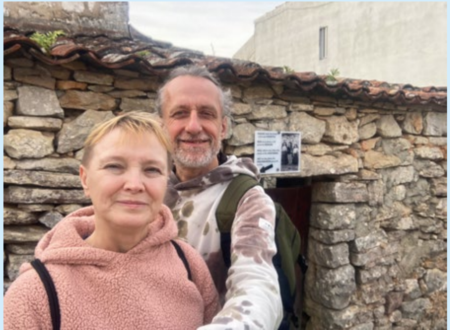
ŚCIANA DOMU, NA TLE KTÓREJ WYKONANO ZDJĘCIE TRÓJKI DZIECI - ALJUSTREL

Przypominają mi się wszystkie słowa Maryi z różnych objawień. Maryja bardzo prosiła – albo na początku, albo na końcu objawień – o to, żeby w tym miejscu powstała jakaś kaplica, kościół, który będzie