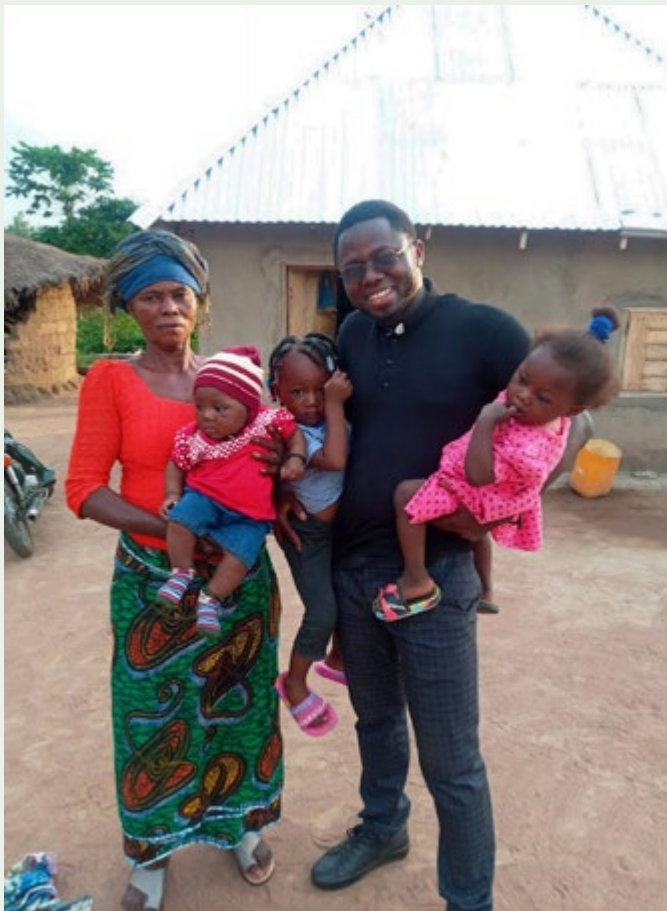
BRAT MARTINS Z MAMĄ I SIOSTRZENICAMI