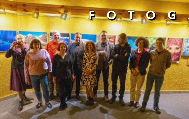
22 III WERNISAŻ ROCZNEJ WYSTAWY KOŁA FOTOGRAFICZNEGO POCZEKAJKA