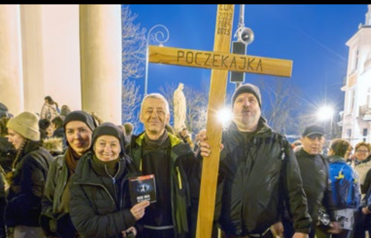
28 III EKSTREMALNA DROGA KRZYŻOWA