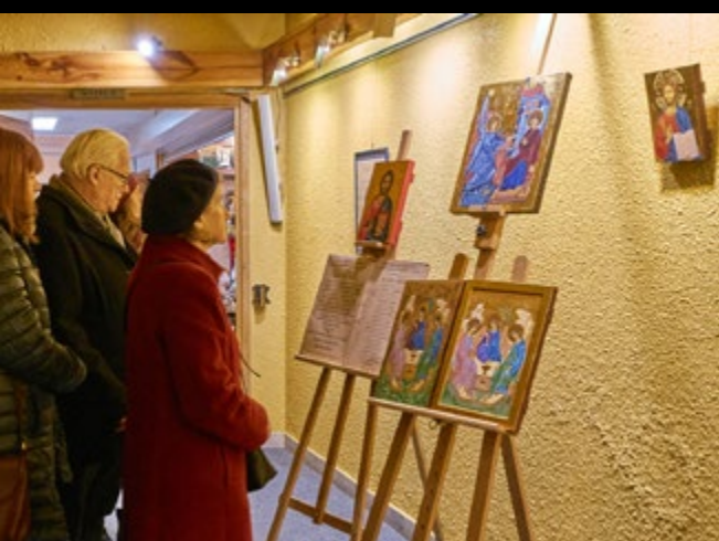
6 IV WYSTAWA IKON Z WARSZTATÓW NA POCZEKAJCE