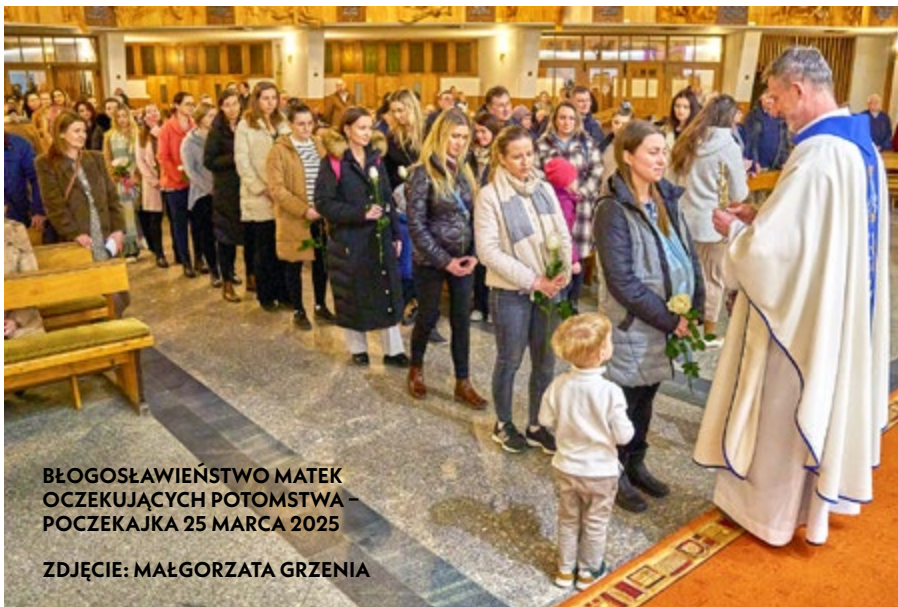
BŁOGOSŁAWIEŃSTWO MATEK OCZEKUJĄCYCH POTOMSTWA – POCZEKAJKA 25 MARCA 2025