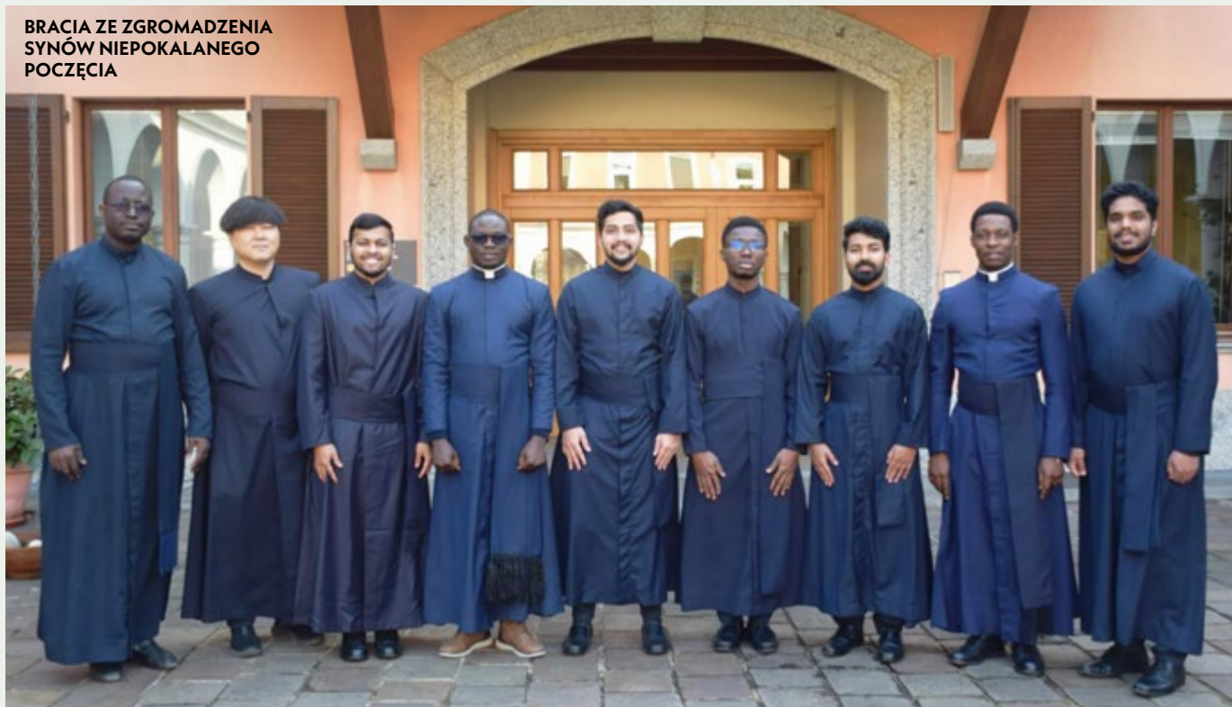
BRACIA ZE ZGROMADZENIA SYNÓW NIEPOKALANEGO POCZĘCIA

Nasz dom znajduje się w Radomiu przy ulicy Zgodnej 6. Jesteśmy obecni na terenie parafii św. Wacława w starym mieście Radom. Nasz apostołat w Polsce, oprócz pewnej pomocy dusz-