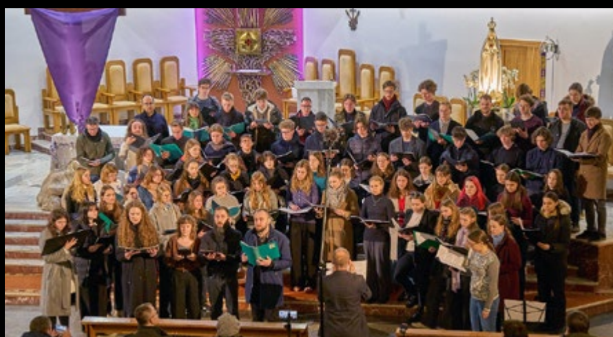
6 IV KONCERT WIELKOPOSTNY CHÓRU UCZNIÓW I ABSOLWENTÓW XXVII LO Z WARSZAWY