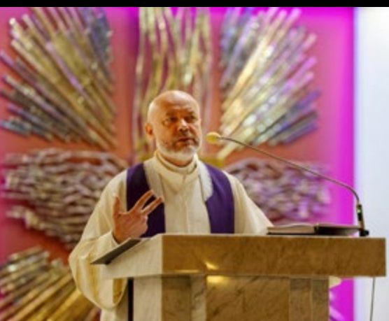
30 III - 2 IV PARAFIALNE REKOLEKCJE WIELKOPOSTNE