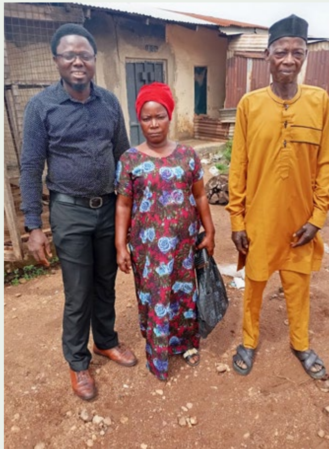
BRAT MARTINS Z OJCEM I CIOCIĄ