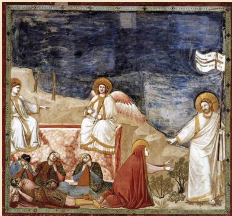
GIOTTO DI BONDONE. ZMARTWYCHWSTANIE

Zdumienia nad tajemnicą Zmartwychwstania Jezusa, wiary pozwalającej przyjąć to, co zda się niemożliwe, i miłości – jako jedynej właściwej odpowiedzi na Miłość