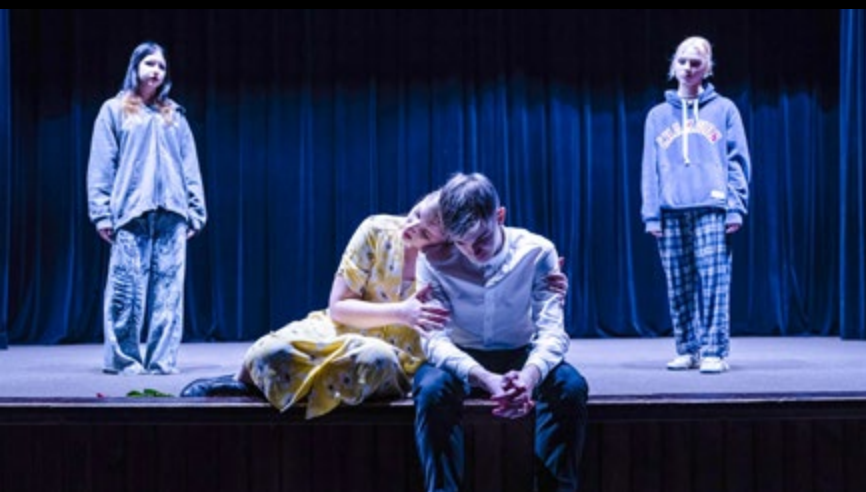
7 III PREMIERA SZTUKI TEATRU KROPKA PO PROSTU „TO SIĘ WYTNIE”