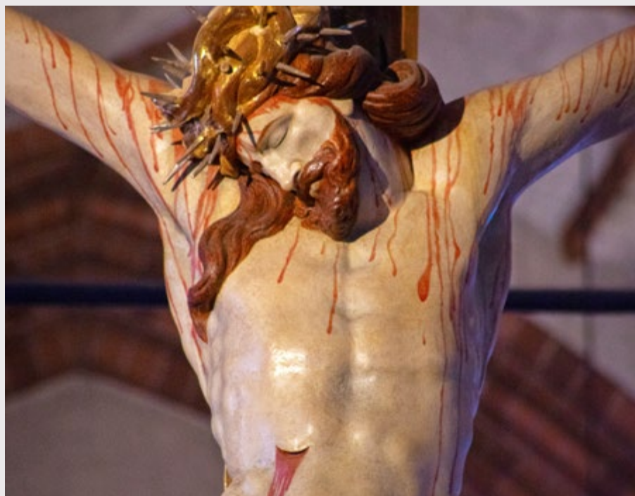
KRZYŻ Z KATEDRY W OLSZTYNIE.

e-mail pisma parafialnego: pismozwiastun@wp.pl