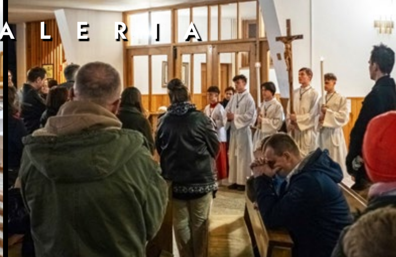
14 III DROGA KRZYŻOWA