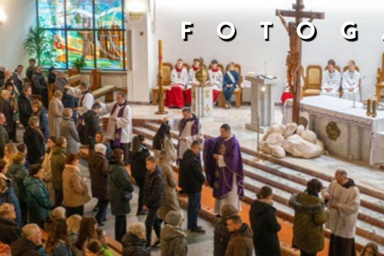
5 III ŚRODA POPIELCOWA FOT. EMIL ZIĘBA