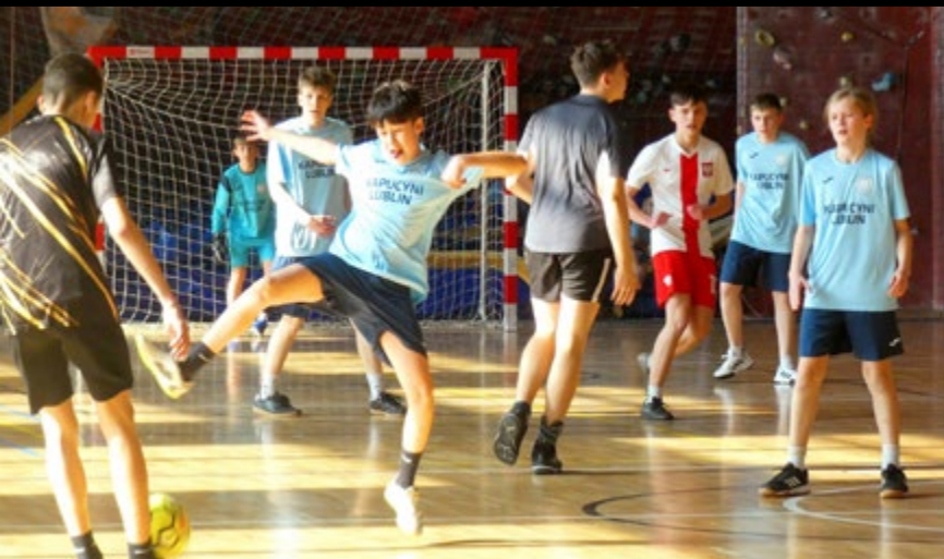
8 III DEKANALNY ETAP XV MISTRZOSTW LSO W PIŁCE NOŻNEJ HALOWEJ. II MIEJSCE NASZYCH MINISTRANTÓW