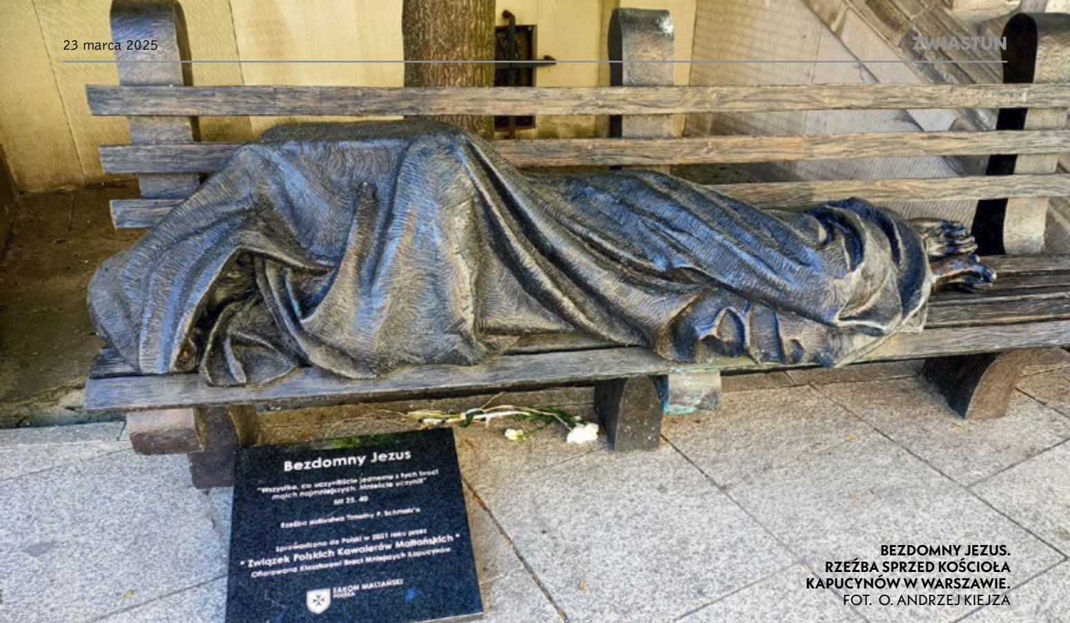
BEZDOMNY JEZUS. RZEŹBA SPRZED KOŚCIOŁA KAPUCYNÓW W WARSZAWIE.