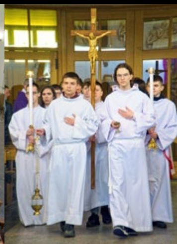
12 III REKOLEKCJE DLA SZKÓŁ ŚREDNICH