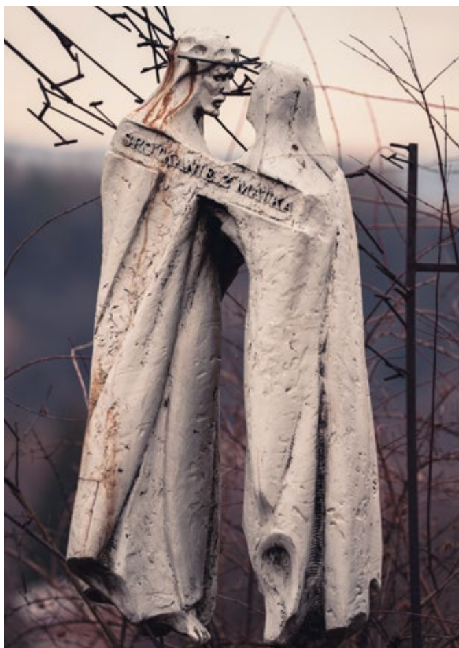
DROGA KRZYŻOWA W ZAGÓRZU. STACJA IV.

Bóg wchodząc w ludzką nędzę, chciał pokazać, że się unióżył. Jak powiedział spowiednik świętego Karola de Foucauld: „Jezus do tego stopnia zajął ostatnie miejsce, że nikt nigdy nie zdołał Mu w tym dorównać!”. Dlatego Jego Matka, tak jak On pochodząca z małego Nazaretu, może się czuć zagubiona w wielkim mieście, w tym zgielku, w którym jest tylu spieszących się ludzi i tylu przeciwników wygrażających Jej Synowi. Ale przecież wielkość człowieka nie polega na tym, skąd pochodzi, ale na tym, jakie ma w sercu wartości. Maryja w zagubieniu wielkiego miasta, na ulicach którego okrutnie dręczony jest Jej Syn, zachowuje niezachwianą godność Matki. Jest całkowicie zjednoczona ze swoim Dzieckiem i gotowa ofiarować za Niego swoje życie. Dlatego tak ważne jest spotkanie Jezusa z Osobą, która Go do końca rozumie, która pokornym Sercem wnika w nieprzeniknione Boże zamysły. Maryja jest też z każdym z nas. Właśnie dlatego jest na