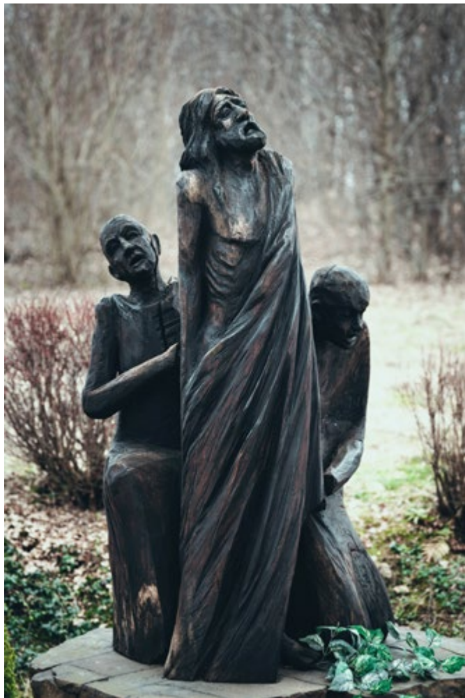
DROGA KRZYŻOWA W ZAGÓRZU. STACJA X.

Trzeci upadek ma inny charakter, bo Jezus, który jest gotowy przyjąć śmierć, wyczerpany fizycznie, ciągle szuka oblicza Ojca. Kaci się srożą. Widzowie tego dramatycznego spektaklu Męki spieszą się i denerwują. On jednak tak jak wtedy, w Ogrójcu i wcześniej podczas swego publicznego nauczania, leży na ziemi przed Ojcem i modli się. W tym trzecim upadku Jezus ukazuje, że my upadając pod ciężarem krzyża, nie musimy innych krzywdzić i bezradnie złościć się na naszą kondycję. Możemy po prostu upaść na kolana i wołać do Ojca, prosić o ratunek, oddawać się pełnieniu Jego woli, ufając, że jak mówił ojciec Pio: „chmury zasłaniają słońce, ale go nie gaszą”. Miłość Ojca jest nieustannie nad nami.