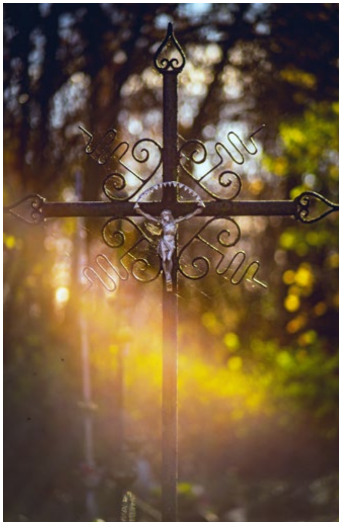
KRZYŻ Z CMENTARZA W GARBOWIE.

Jezus oddaje dla człowieka swój czas, gdy naucza, swoje siły, gdy krzepi tych, którzy są chorzy. Gdy oddaje swoje życie przybity do krzyża, oddaje coś jeszcze większego, oddaje swoją więź z Ojcem. Ten, który wchodzi w otchłań ludzkiego zła, doświadcza tego, co mówił prorok: „będą pić kielich pieniący się przyprawionym