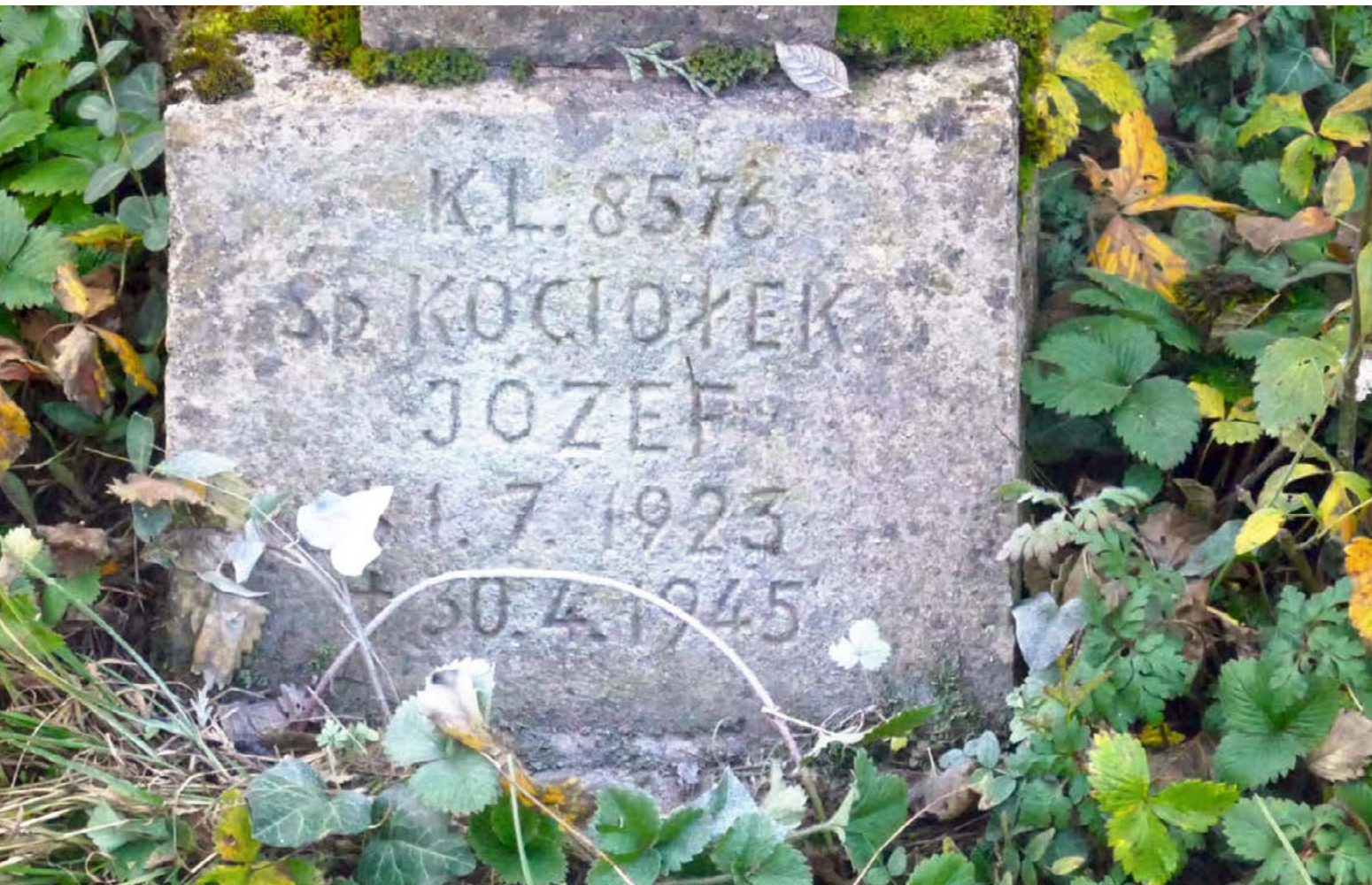
ZDJĘCIE GROBU JÓZEFA UZYSKANE PRZEZ INTERNET