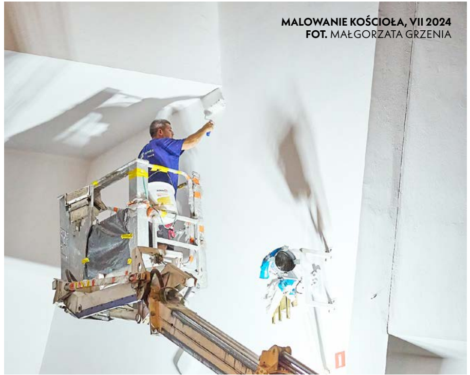
MALOWANIE KOŚCIOŁA, VII 2024

Spotykam jedną panią na kołędzie, a ona taka rozpromieniona mówi, że nie potrafi tej radości w sobie opanować. Pytam, dlaczego, co się stało? A pani mówi: byłam w uroczystość Objawienia Pańskie-