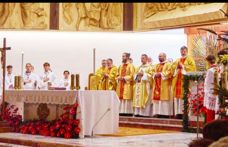
24 XII 2024 PASTERKA