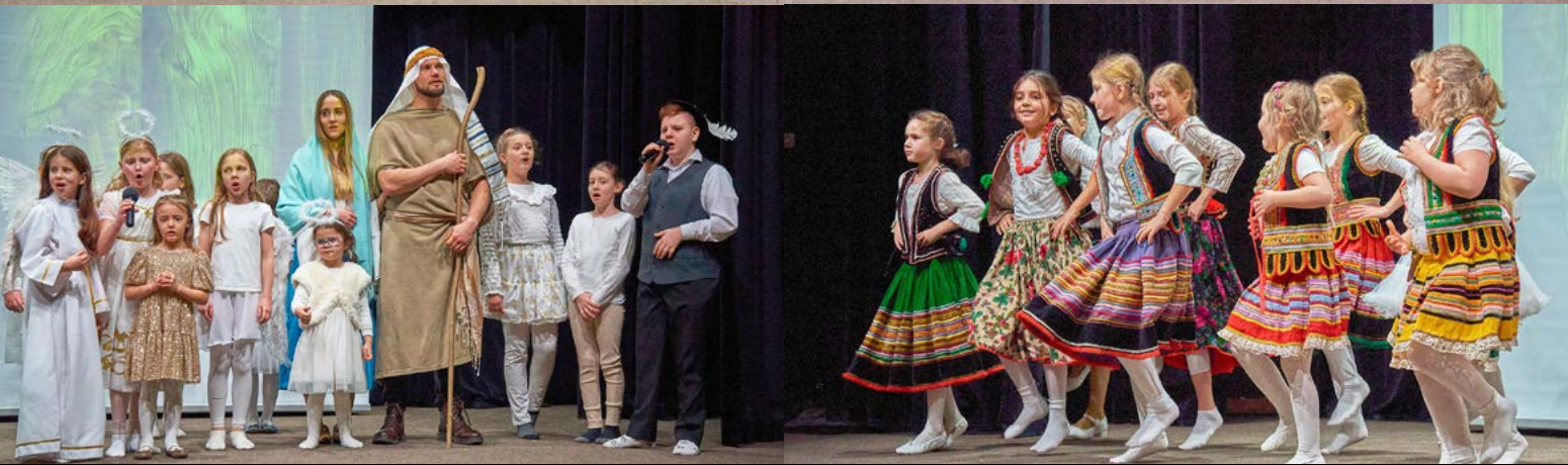
25 I 2025 JASEŁKA PARAFIALNE