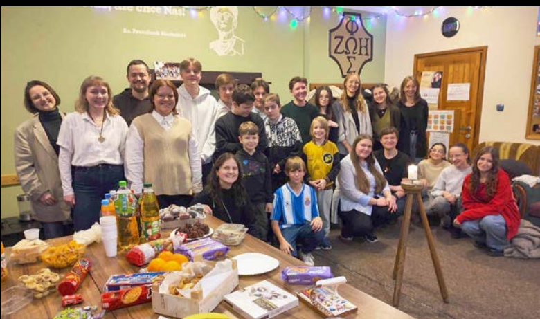
4 I 2025 SPOTKANIE OPŁATKOWE OAZOWICZÓW