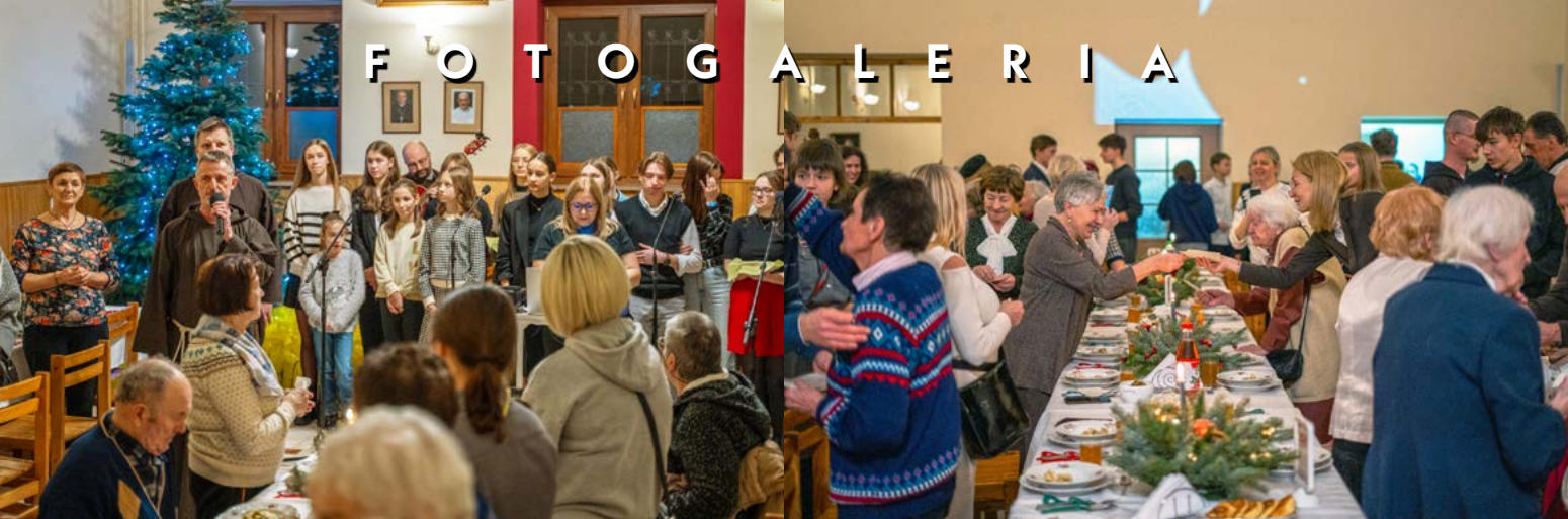
22 XII 2024 WIGILIA DLA SAMOTNYCH FOT. EMIL ZIĘBA