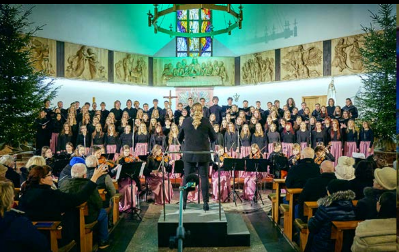
19 I 2025 ŚWIĄTECZNY KONCERT CHÓRÓW COPERNICUS I AXIS MUNDI