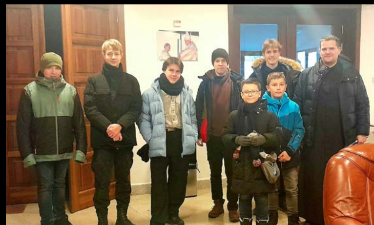
12 I 2025 DRUŻYNA LEKTORÓW I MINISTRANTÓW W KONKURSIE WIEDZY LITURGICZNEJ