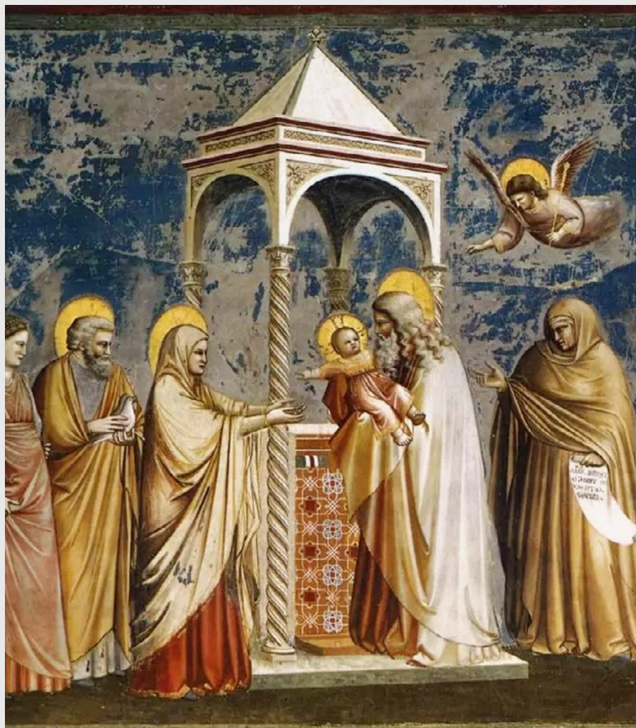
GIOTTO DI BONDONE. OFIAROWANIE JEZUSA W ŚWIĄTYNI

e-mail pisma parafialnego: pismozwiastun@wp.pl