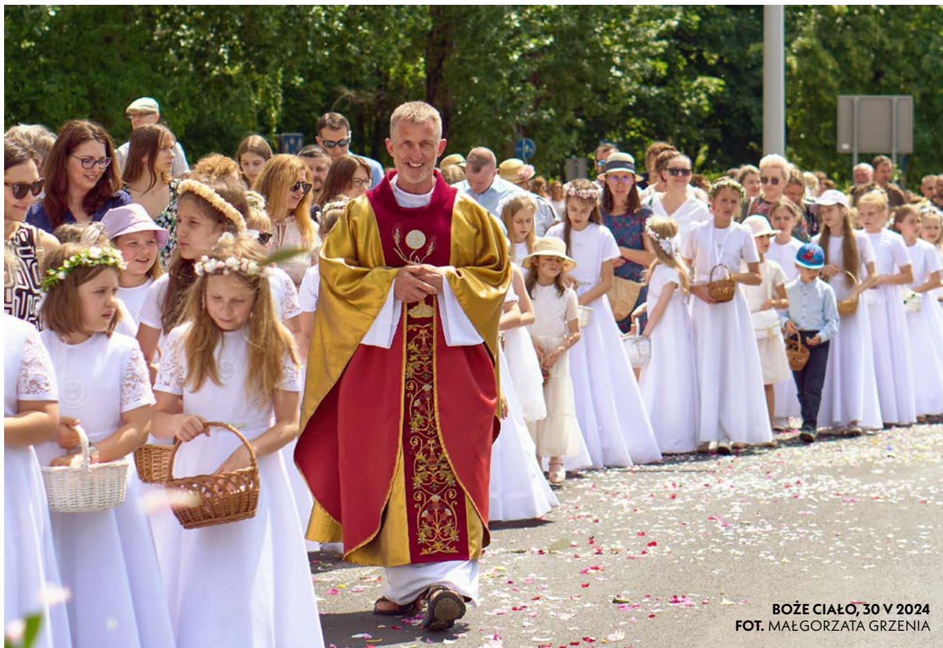
BOŻE CIAŁO, 30 V 2024