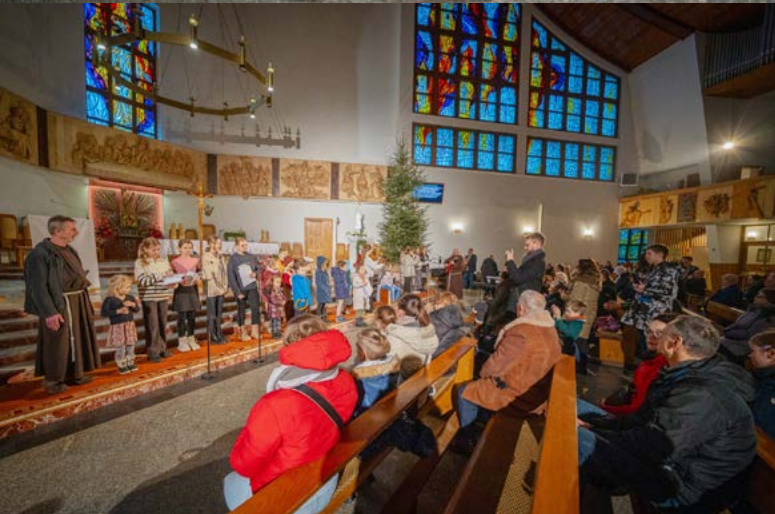
12 I 2025 WSPÓLNE KOLĘDOWANIE PRZY SZOPCE