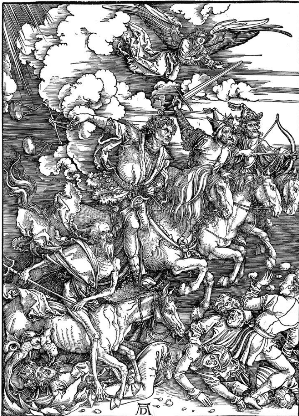
ALBRECHT DÜRER. APOKALIPSA

Księgę Apokalipsy możemy podzielić na trzy części. Pierwsza, która jest pewnego rodzaju wstępem, zawiera Listy do Kościołów – czyli do konkretnych wspólnot, a nie do pojedynczych osób, którym Bóg pokazuje pewne cechy, na które oni, właśnie jako całość, muszą zwrócić uwagę – jakie mają silne strony, a w czym jeszcze muszą się poprawić, co wzmocnić, czego zaprzestać. Faktem jest, że w całej księdze występuje język bardzo tajemniczy, symboliczny, z którym możemy mieć problemy. Mają one oczywiście swoje znaczenie, dlatego bibliści z pewnością polecają, aby je wytłumaczyć, aczkolwiek oni sami też twierdzą, że rozumieją nikłą część znaczeń, ale zawsze to już coś więcej. Nato-