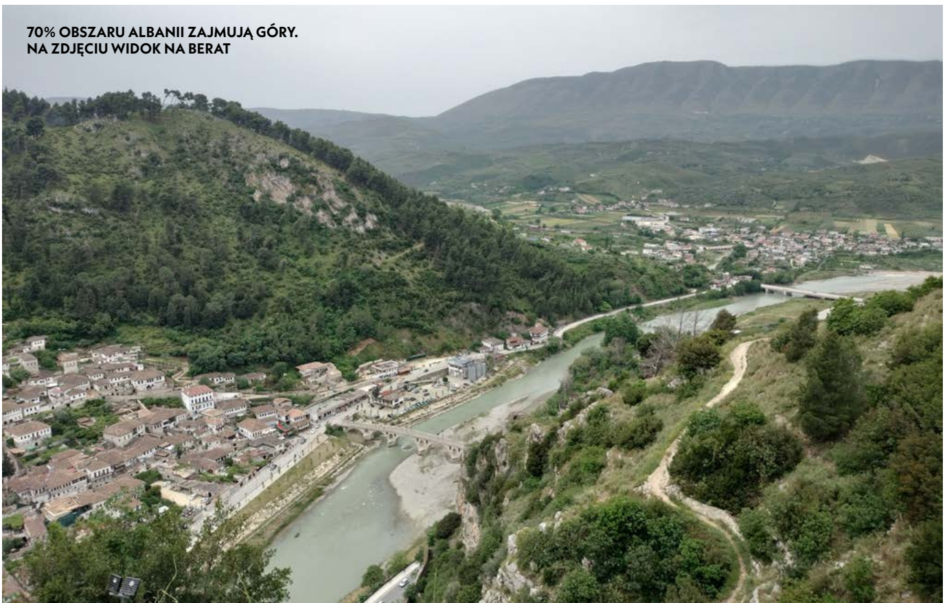
70% OBSZARU ALBANII ZAJMUJĄ GÓRY. NA ZDJĘCIU WIDOK NA BERAT