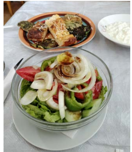
TYPOWY ALBAŃSKI OBIAD

Powojenna historia Albanii naznaczona rządami komunistów była możliwa dlatego, że jedynie oni byli wówczas zorganizowaną siłą polityczną; nie mieli opozycji wyposażonej w świadomą elitę. Wygrali zdecydowanie wybory i objęli władzę na