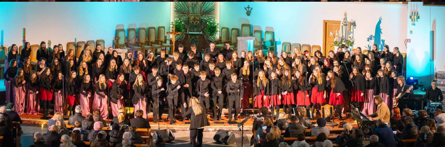
16 XI KONCERT CHÓRÓW COPERNICUS I OUR VOICE