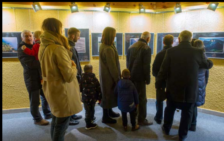
17 XI WYSTAWA ZDJĘĆ KOŁA FOTOGRAFICZNEGO Z PLENERU W PIENINACH