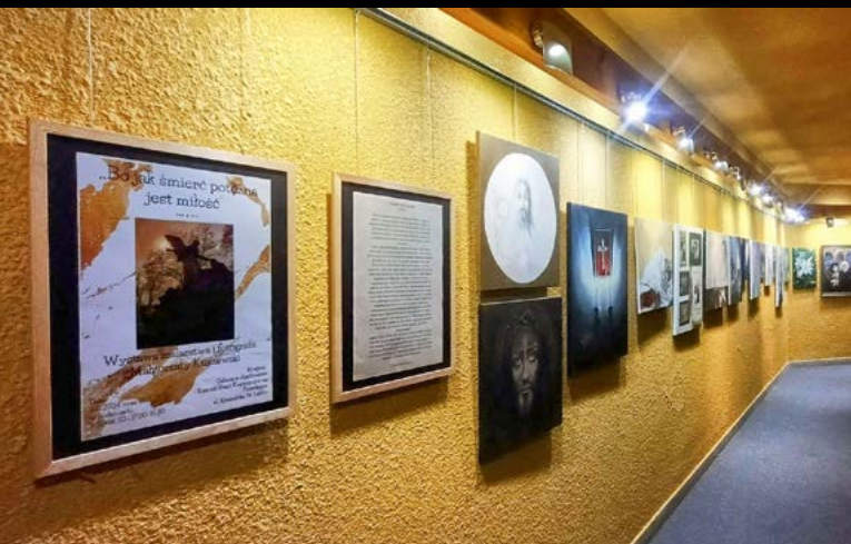
3 XI WYSTAWA MALARSTWA I FOTOGRAFII MAŁGORZATA KUSZEWSKI FOT. MAŁGORZATA KUSZEWSKI