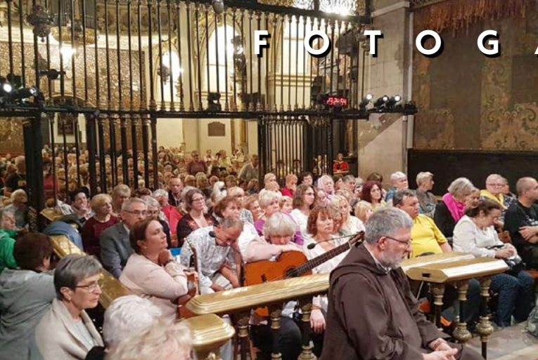
28 IX PIELGRZYMKA GRUPY MODLITWY OJCA PIO NA JASNĄ GÓRĘ FOT. BR. ROBERT KRAWIEC