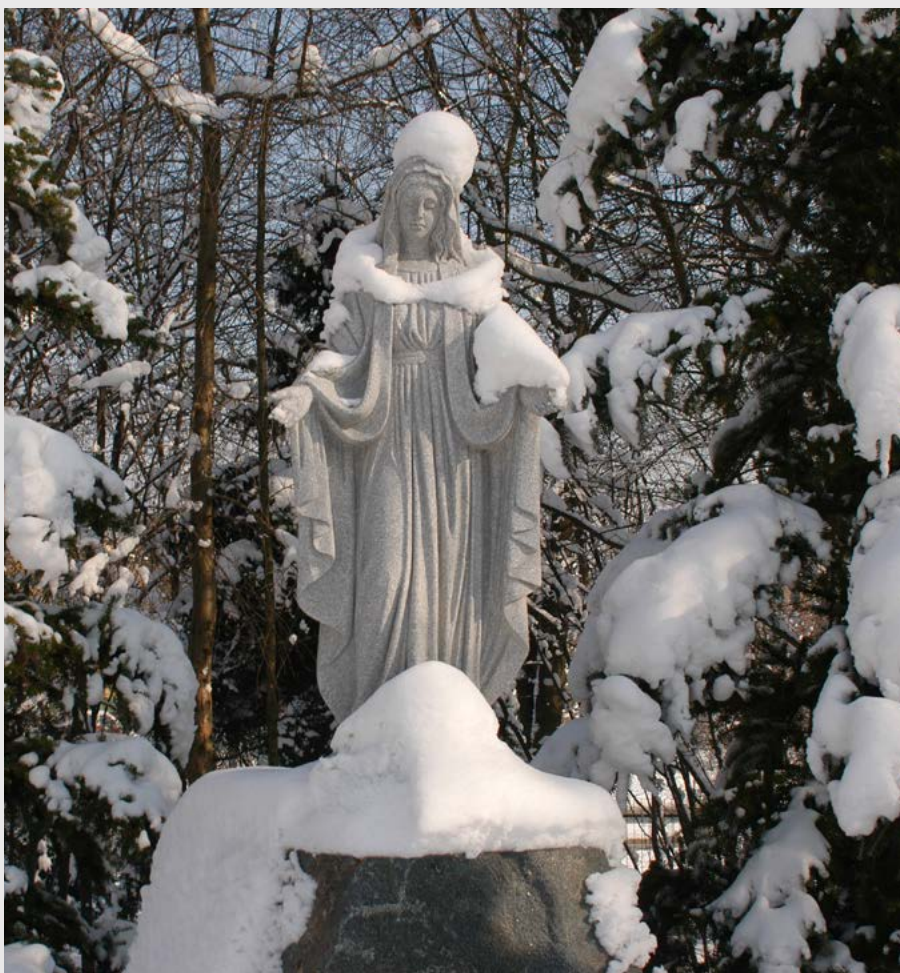
FIGURA MATKI BOŻEJ Z OGRODU KAPUCYNÓW NA POCZEKAJCE.

Autorami komentarzy do Ewangelii są członkowie FZŚ Poczekajka