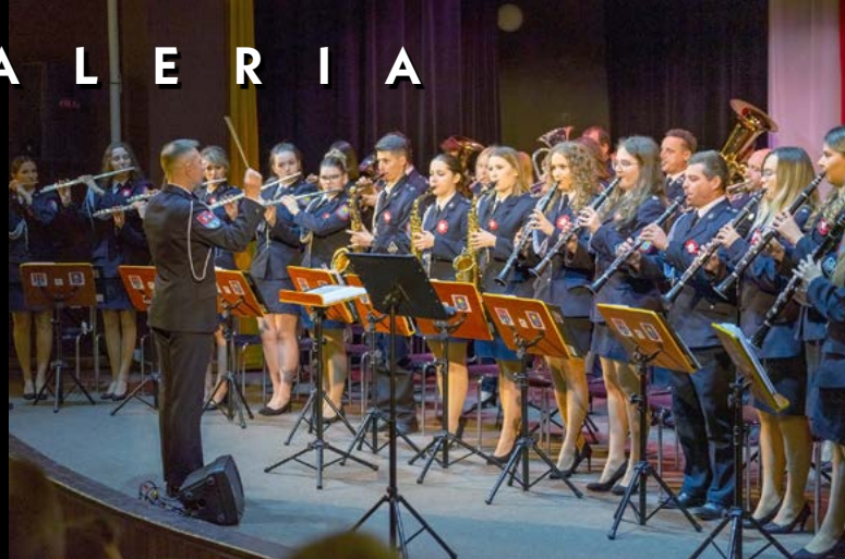
10 XI KONCERT PATRIOTYCZNY. ORKIESTRA DĘTA STRAŻY POŻARNEJ Z LUBARTOWA