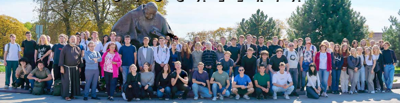
25 IX PIELGRZYMKA MATURYSTÓW NA JASNĄ GÓRĘ FOT. MAŁGORZATA GRZENIA