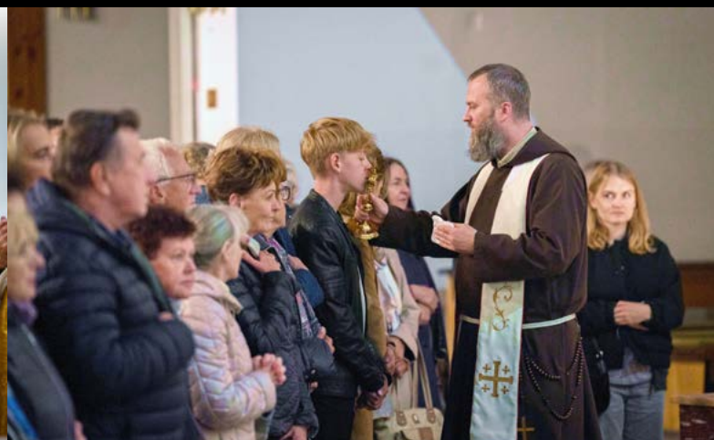
4 X ODPUST ŚWIĘTEGO FRANCISZKA