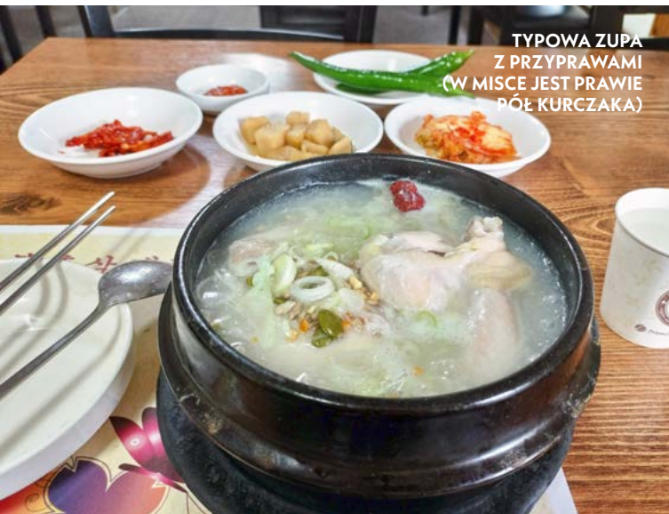
TYPOWA ZUPA Z PRZYPRAWAMI (W MISCIE JEST PRAWIE PÓŁ KURCZAKA)

Seul był niszczone na skutek wojen i kataklizmów. W ruinę poszły liczne zabytki, choćby pałace i stare świątynie, ale wiele miejsc odbudowano i udatnie wtopiono w nowoczesną architekturę. Ci, którzy chcieliby zobaczyć miejsca związane z dawną historią, mogą np. obejrzeć odbudowane królewskie siedziby i ogrody lub świątynię Bongeunsa – klasztor buddyjski z VIII w. (odpowiednik Częstochowy dla koreańskich buddystów) – nota bene stale czynny, bo wyznawcy Buddy stanowią ok. 16% populacji Korei Południowej, a kilka procent to wyznawcy szamanizmu. Ostatnio przybywa też muzułmanów. Jak podają oficjalne sondaże prawie 50% Koreańczyków to ateści. Religię zastępuje etyka rodem z konfucjanizmu. Zauważyłem, że Koreańczycy to bardzo grzeczni ludzie. Panuje wyraźna hierarchia społeczna. Starszy ma zawsze pierwszeństwo przed młodszym.