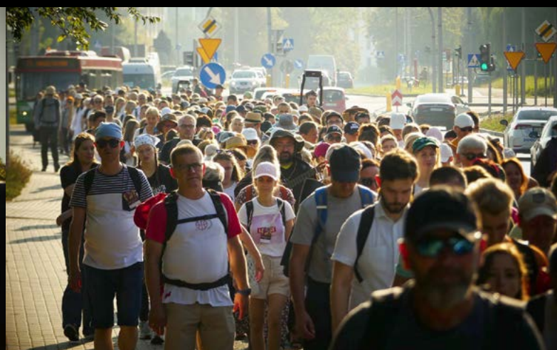
31 VIII PIELGRZYMKA DO WĄWOLNICY