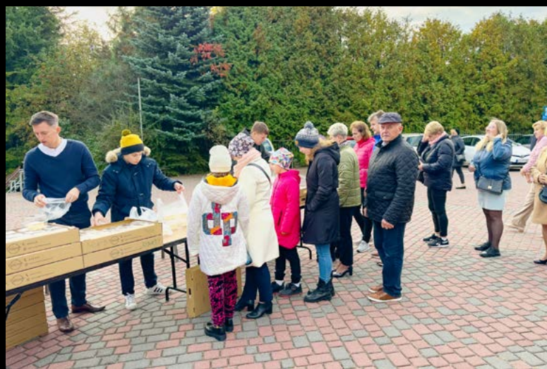
13 X KREMÓWKI PAPIESKIE