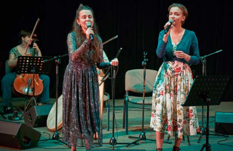
6 X ORATORIUM O STWORZENIU