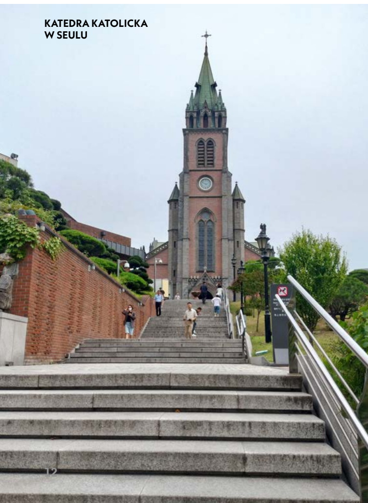
KATEDRA KATOLICKA W SEULU

W roku 1900 tylko 1% Koreańczyków identyfikował się z wiarą chrześcijańską. Wyraźny wzrost liczby wiernych zaznaczył się dopiero po bardzo krwawej wojnie koreańskiej (1950–1953) zakończonej podziałem półwyspu na dwa państwa. Wpływy amerykańskie w Korei Południowej spowodowały, że nastąpiła tu moda na chrześcijaństwo w kręgach ludzi biznesu i polityki. 17% Koreańczyków to protestanci, gdyż Korea była przez lata krajem misyjnym dla protestantów amerykańskich, dlatego łatwo tu zauważyć kościoły protestanckie o charakterystycznych neogotyckich dzwonicach w stylu amerykańskim. Ich podświetlane krzyże przypominają, że jest to najbardziej chrześcijański kraj Azji wschodniej. Protestantyzm w wydaniu koreańskim ma swoje dobre i złe stro-