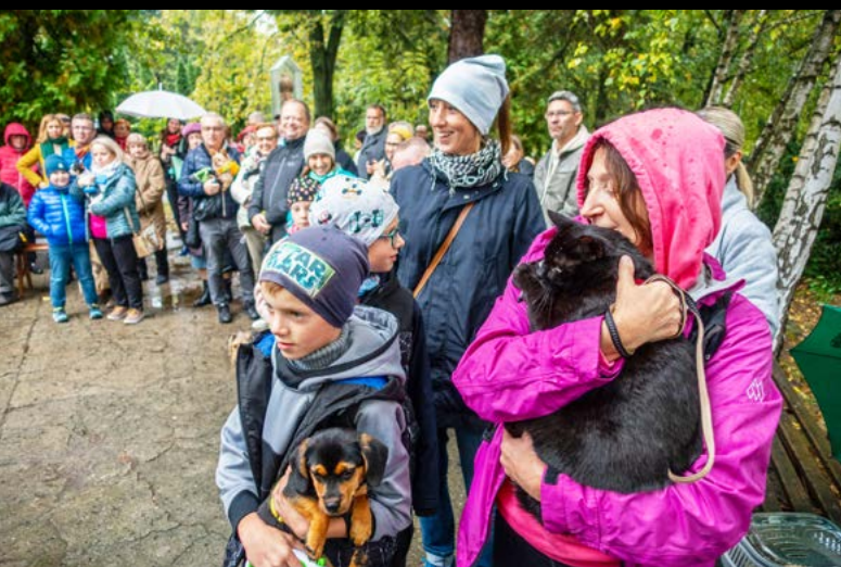
6 X NIEDZIELA ŚWIĘTEGO FRANCISZKA