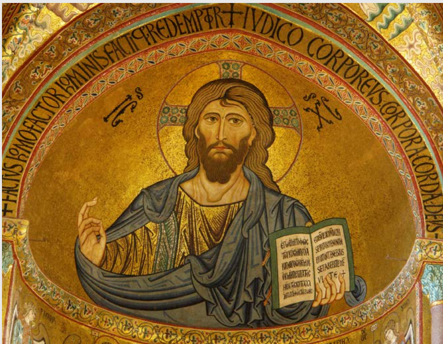
CHRYSZTUS PANTOKRATOR – MOZAIKA W APSYDZIE KATEDRY W CEFALÙ

e-mail pisma parafialnego: pismozwiastun@wp.pl