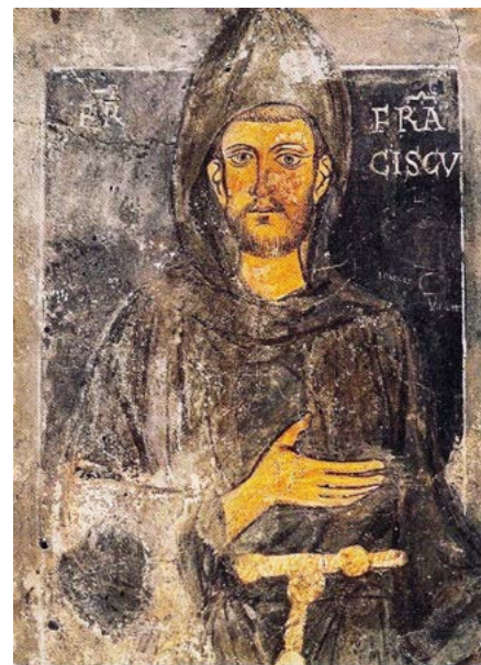
Fresk Maestro di San Gregorio w opactwie benedyktyńskim w Subiaco

Wprawdzie, ów motyw snu papieża możemy dostrzec także w hagiografiach innych świętych, ale sądzę, że w tym konkretnym przypadku ze św. Franciszkiem, to była jednak prawda. Innocenty jako papież widział, że Kościół się wali – wewnętrznie rozdarty, szarpany problemami, ambicjami, grzechami – Kościół stawał się coraz silniejszy politycznie i coraz słabszy duchowo. Arystokracja walczyła o kościelne urzędy i własność, pobożne jednostki „porzucały świat” i zamykały się w klasztorach, lud, pozostawiony sam sobie, tworzył dla siebie nowe formy pobożności, niezgodne, a niekiedy i celowo sprzeciwiające się nauczaniu Kościoła... Kościół się walił, chociaż na pierwszy rzut oka miał się świetnie. Ale napięcia – między arystokracją a plebem, między duchowieństwem a laikatem, nienawiść do innego, podziały na „swoją-obcy” nawet w obrębie jednego miasta, między miastami, niekończące się wojny, ofiary, jeńcy, tortury... czyniły z tego świata, świata chrześcijańskiego, przedsiónek piekła na ziemi. Świat pogrążony w nienawiści, pogardzie dla życia i godności człowieka