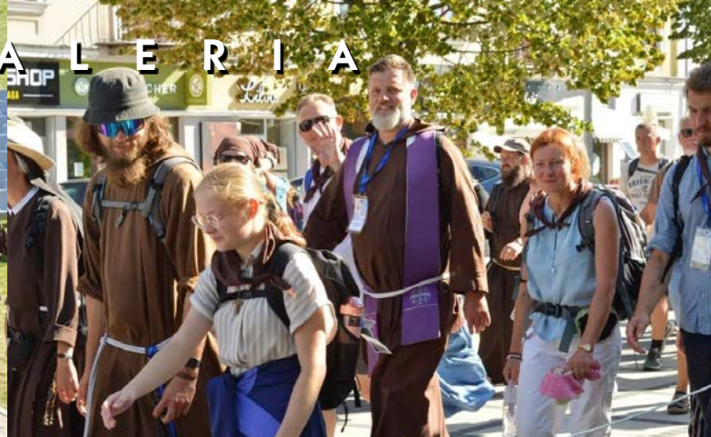
3-14 VIII PIELGRZYMKA NA JASNĄ GÓRĘ