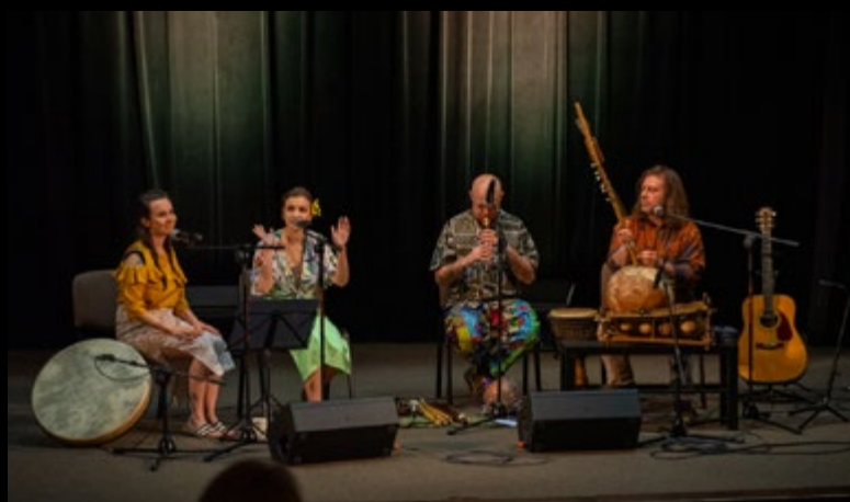
28 IV KONCERT MISYJNY „DRZEWO UMARŁE, PRZEPUŚĆ NAS”