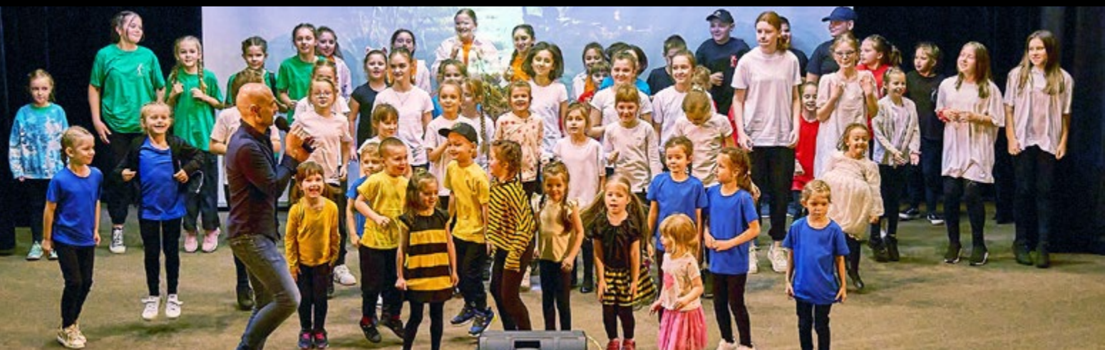
14 SPEKTAKL TANECZNY „TAŃCZYLI DŁUGO I SZCZĘŚLIWIE”