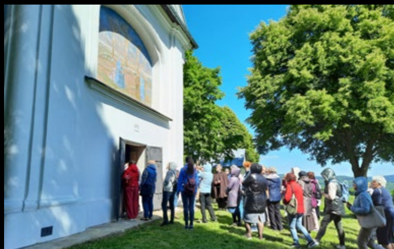
12 V PIELGRZYMKA GRUPY MODLITWY OJCA PIO DO KALWARII PAĆŁAWSKIEJ