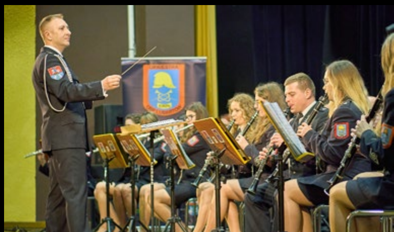
14 IV WIOSENNY KONCERT ORKIESTRY DĘTEJ PRZY OCHOTNICZEJ STRAŻY POŻARNEJ W LUBARTOWIE