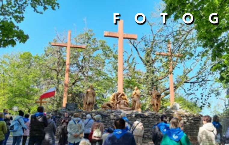
15-24 IV PIELGRZYMKA DO LOURDES