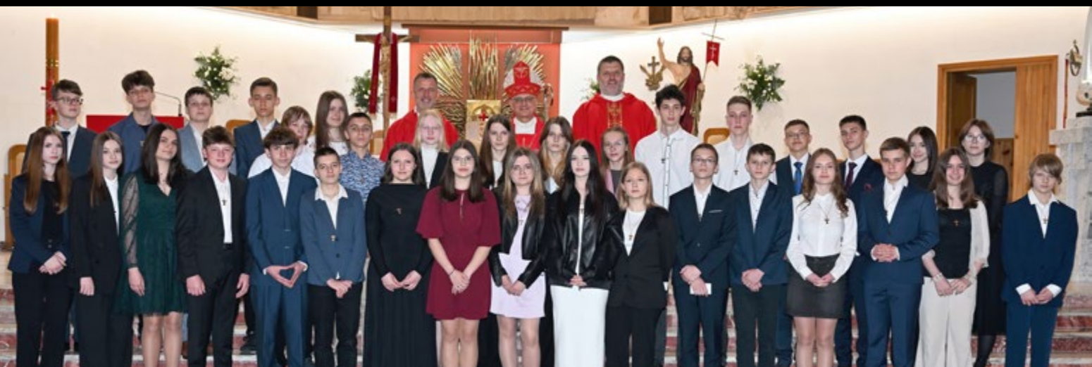
13 IV SAKRAMENT BIERZMOWANIA