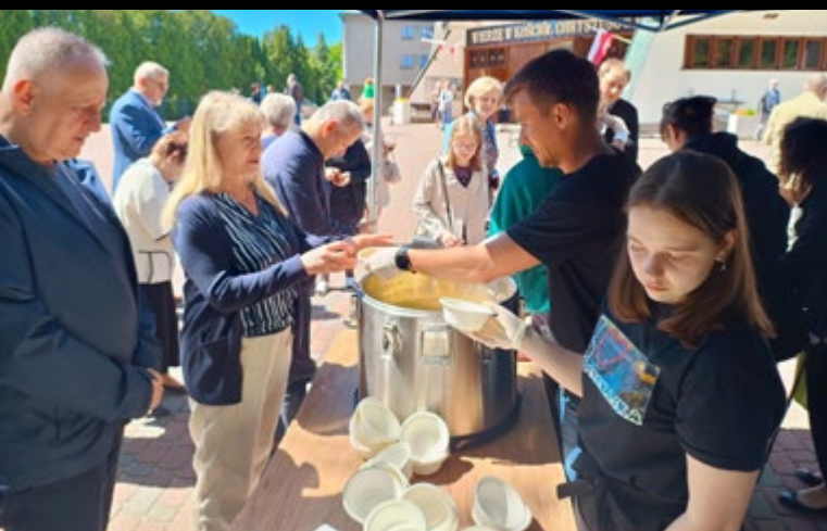
12 V GROCHÓWKA STOWARZYSZENIA PRZYJACIÓŁ PARAFII POCZEKAJKA