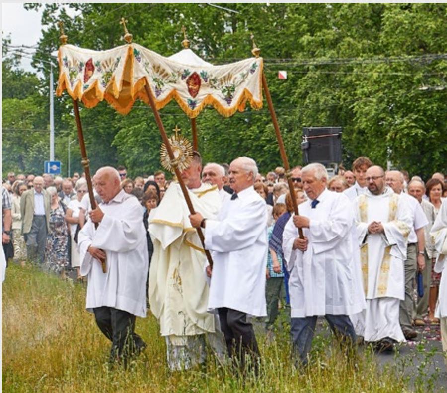
BOŻE CIAŁO NA POCZEKAJCE 2023.

Czy wierzę, że moi bliscy i ja sam jesteśmy na drodze wzrostu, który dokonuje się we własnym tempie, sam z siebie?