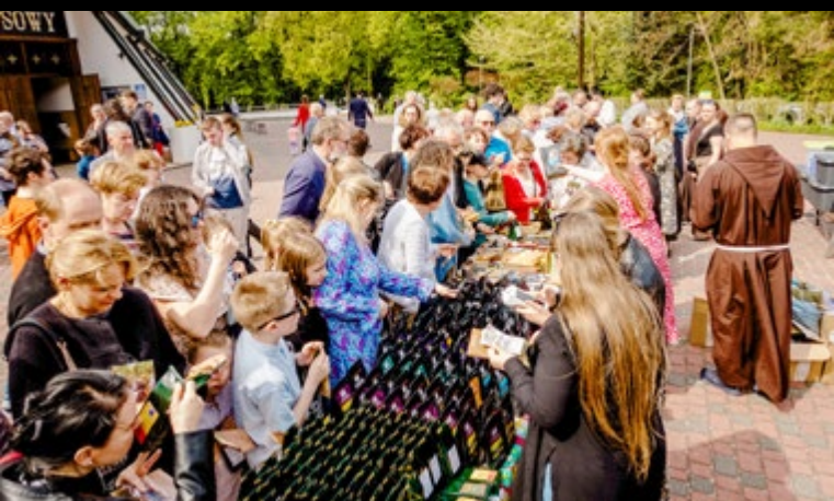
28 IV NIEDZIELA MISYJNA „OKO W OKO Z AFRYKĄ”