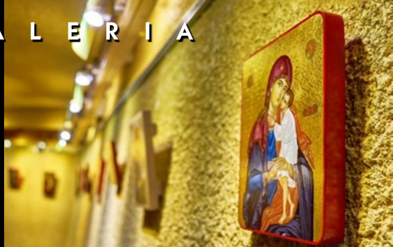
7 IV WYSTAWA IKON