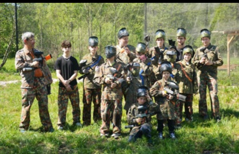
4 V PAINTBALL MINISTRANTÓW I LEKTORÓW