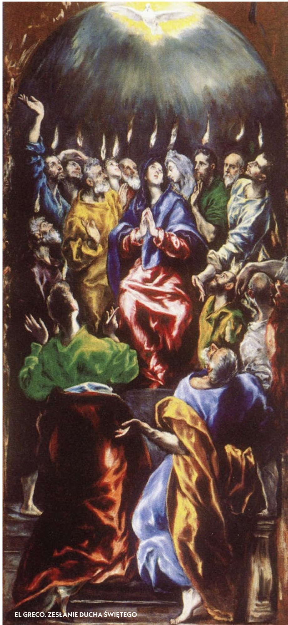
EL GRECO. ZESŁANIE DUCHA ŚWIĘTEGO