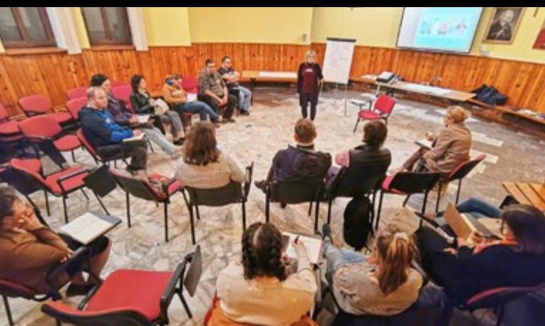
12-13 IV WARSZTATY „ZAPANUJ NAD GNIEWEM” FOT. MAŁGORZATA GRZENIA