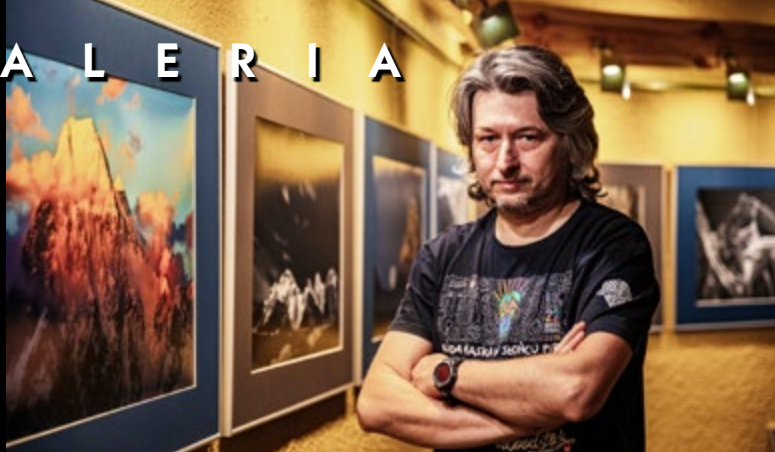
21 IV WYSTAWA FOTOGRAFII GRZEGORZA SURMACZA „KARAKORUM”