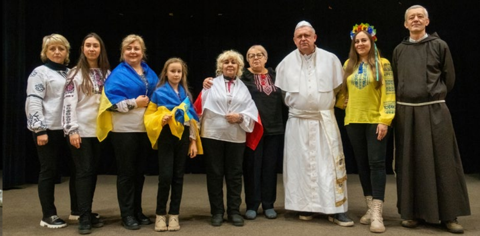
11 II SZTUKA „BÓG CIĘ SŁYSZY”. LWOWSKI TEATR EMMANUEL IM. KAROLA WOJTYŁY