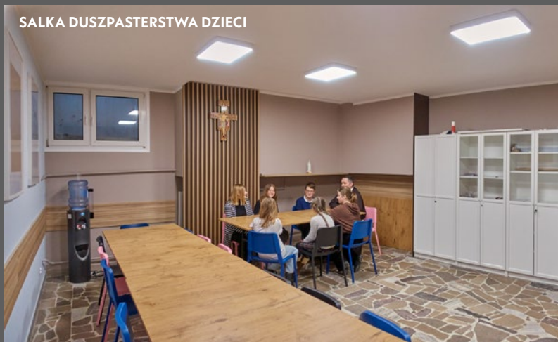
SALKĄ DUSZPASTERSTWA DZIECI