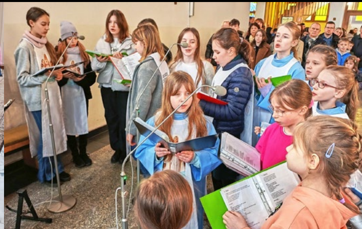
18 II MSZA Z UDZIAŁEM DZIECI