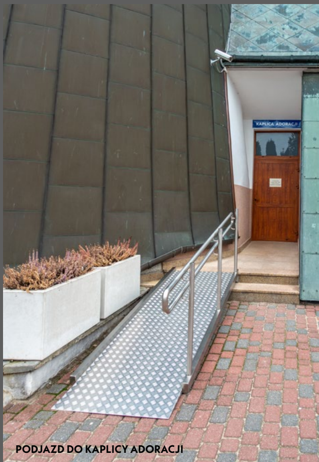
PODJAZD DO KAPLICY ADORACJI