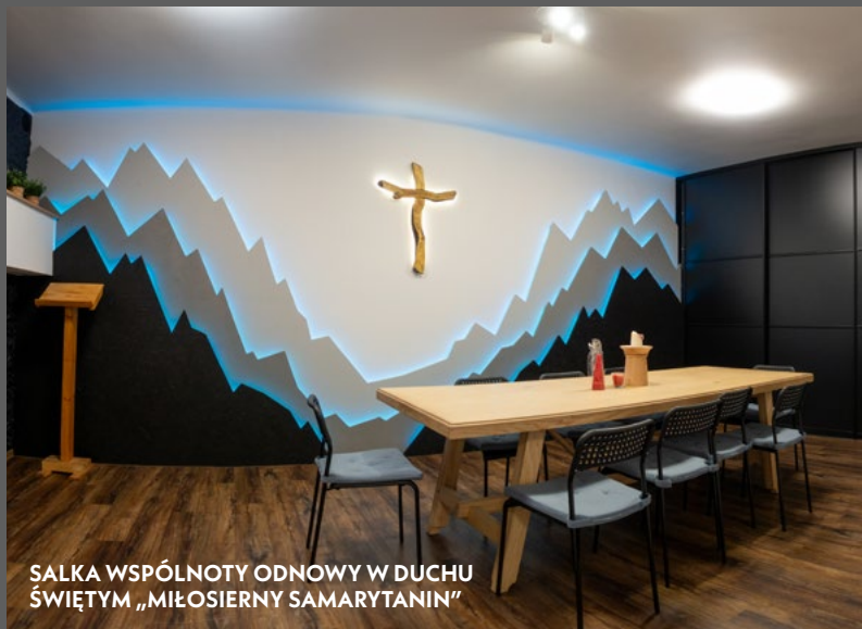
SALKĄ WSPÓLNOTY ODNOWY W DUCHU ŚWIĘTYM „MIŁOSIERNY SAMARYTANIN”