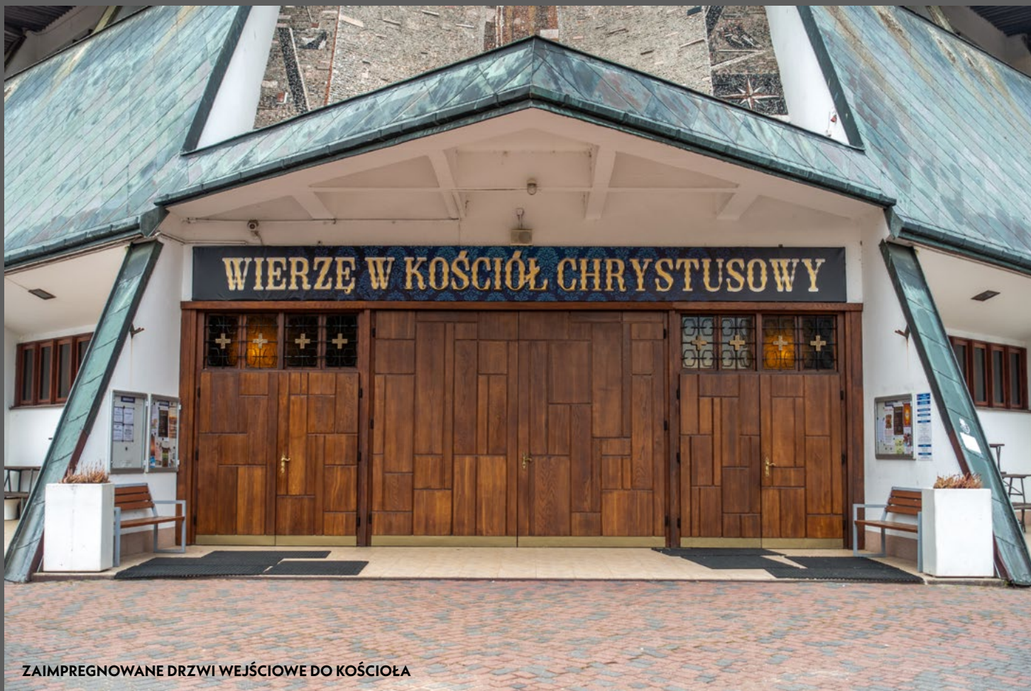
ZAIMPREGNOWANE DRZWI WEJŚCIOWE DO KOŚCIOŁA