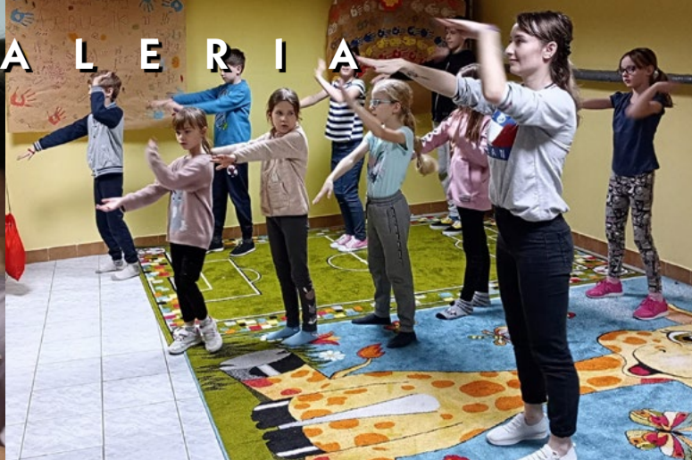
29 I - 2 II FERIA ZIMOWE NA POCZEKAJCE