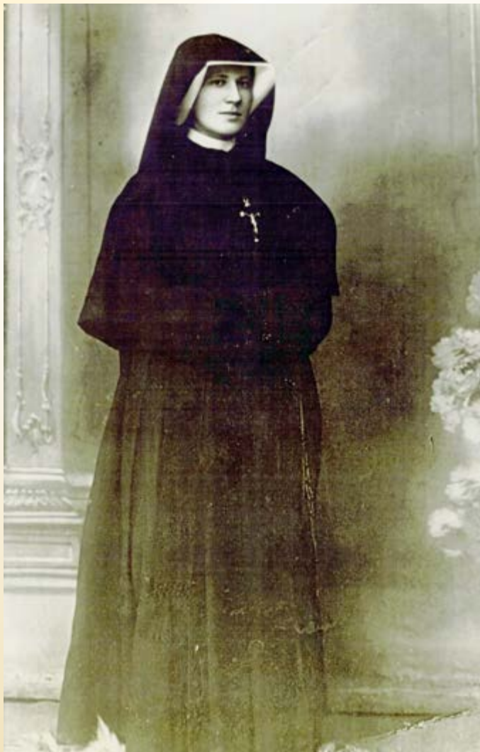
SIOSTRA FAUSTYNA, 1931 R.

i dopiero w Zgromadzeniu Sióstr Matki Bożej Miłosierdzia przełożona kazała jej zapytać Pana tego domu, czy ją przyjmie. Helena zapytała więc Jezusa, który był Panem domu zakonnego, i otrzymała odpowiedź twierdzącą: „Przyjmuję, jesteś w sercu moim”. Dowiedziawszy się o tym matka przełożona powiedziała: „Jeżeli Pan przyjął, to i ja przyjmę”.